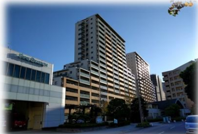
存在感のある高層棟(E棟 & D棟)

小さな森を想像させるフォレストパークとウォーターガーデンの造形美は、住む人だけでなく、通り過ぎる人さえも和ませます。唯一の低層棟であるA棟は、起伏のある公園や学校施設が目の前に広がり、ガーデンズストリート(植栽)沿いに建つ特徴的な建物。