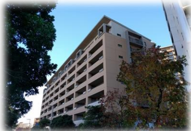
落ち着いた雰囲気の高層棟(A棟)