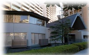
センスの良いエントランス