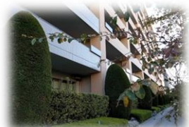
手入れの行き届いた植栽